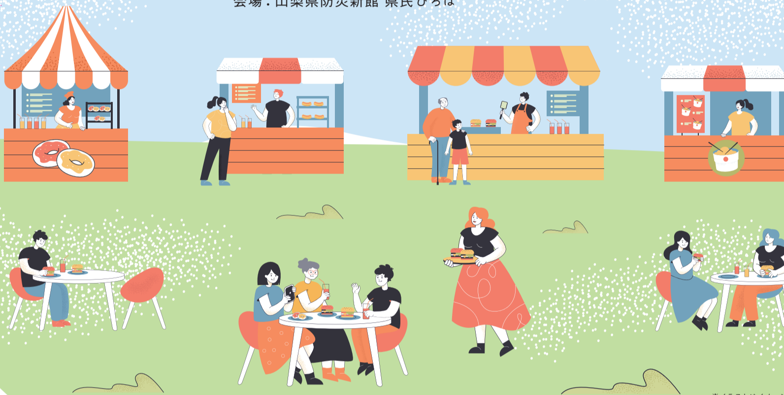
※イラストはイメージです。マルシェ会場に飲食スペースはございません。

みなさんにご購入いただいたランチメニューの売上金の一部と、まちかど募金は、がん治療研究(山梨大学医学域)に、寄付させていただきます。